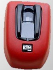
K!M KD-FVP desktop